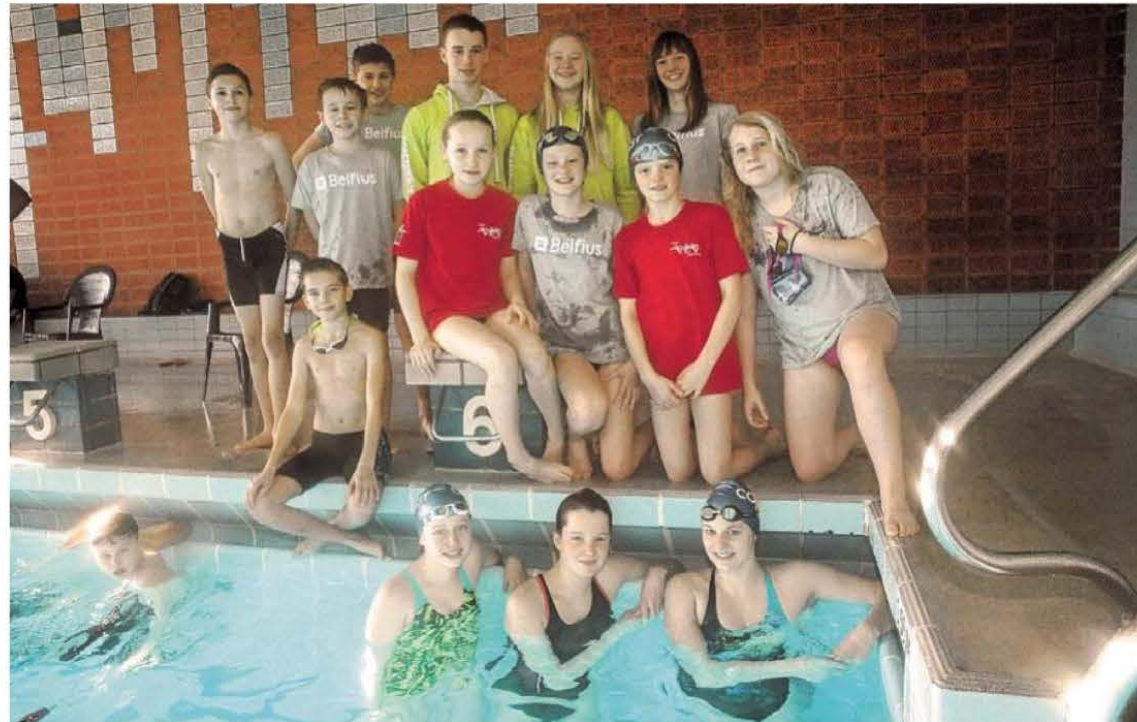
Op de foto zien we de Veurnse deelnemers aan de interclubwedstrijd.

De 31-jarige Oostduinkerkenaar is bezig aan zijn zesde jaar als trainer en dat is niet altijd even gemakkelijk. “Het is zoveel meer dan alleen maar oefeningen ge-